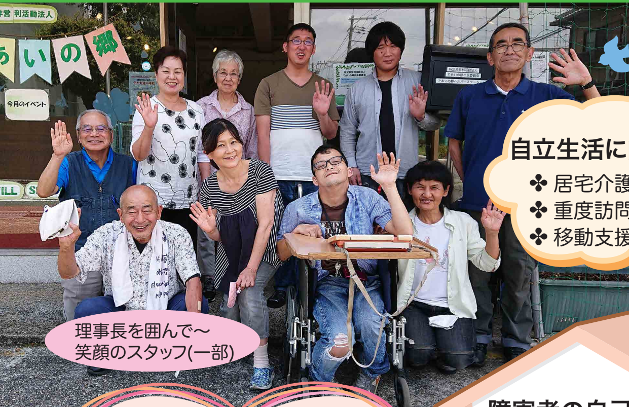
理事長を囲んで～ 笑顔のスタッフ(一部)